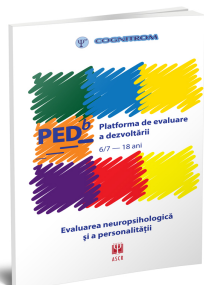
Platformă de evaluare a dezvoltării 6/7-18/19 ani (PEDb)